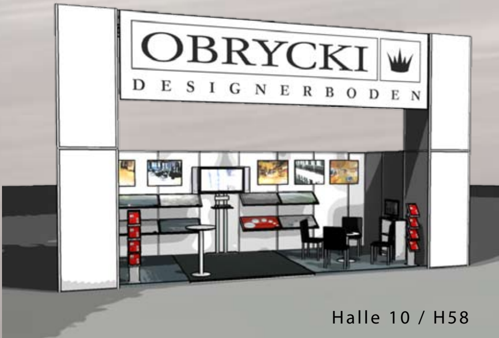
Halle 10 / H58